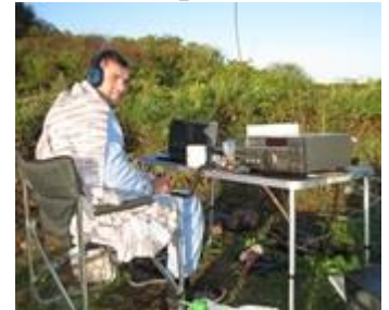
Фото антенны, членов команды и островных видов: